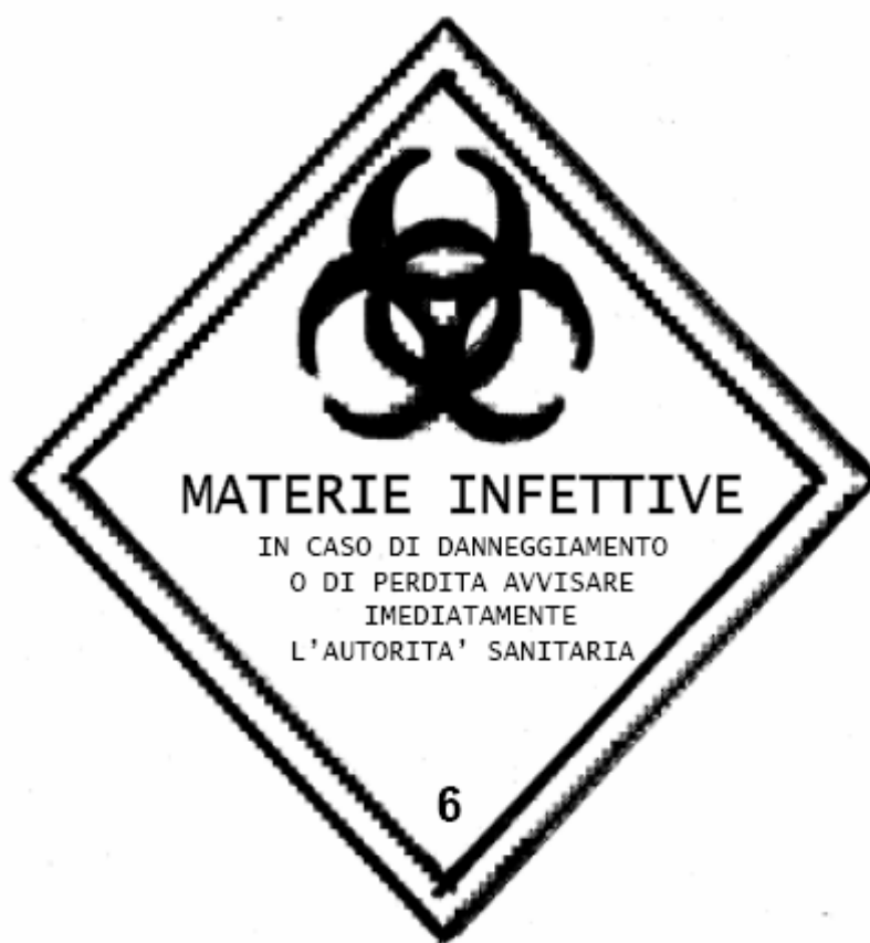
Figura 1: Etichetta di rischio per sostanze infettive